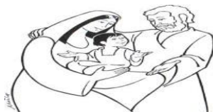
PÉROLAS DO PAPA FRANCISCO: